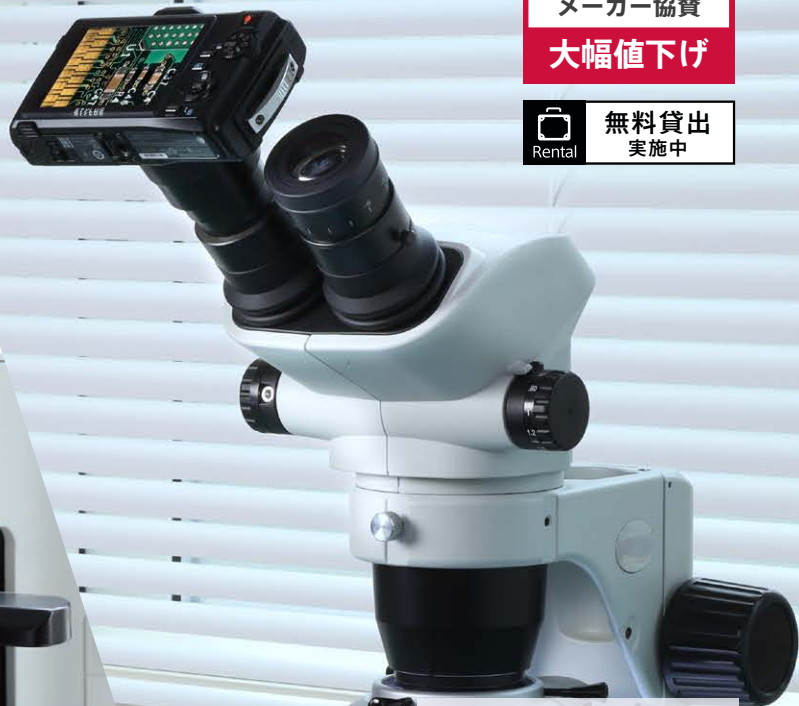
Cマウントへの取付けも可能 (三眼鏡筒)