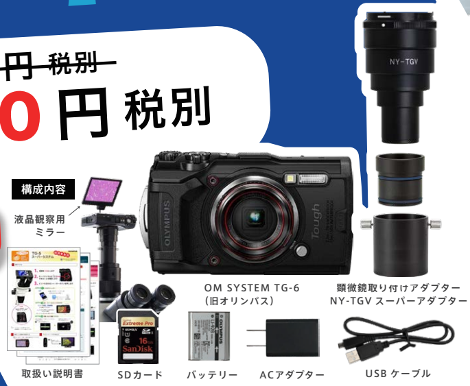
構成内容 液晶観察用ミラー 取扱い説明書 SDカード バッテリー ACアダプター USBケーブル OM SYSTEM TG-6 (旧オリンパス) 顕微鏡取り付けアダプター NY-TGV スーパーアダプター