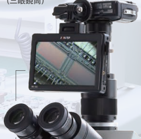
(別売) 5.5インチカメラ取り付けモニター DC-55 + 取付け用オプション