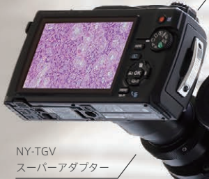
NY-TGV スーパーアダプター